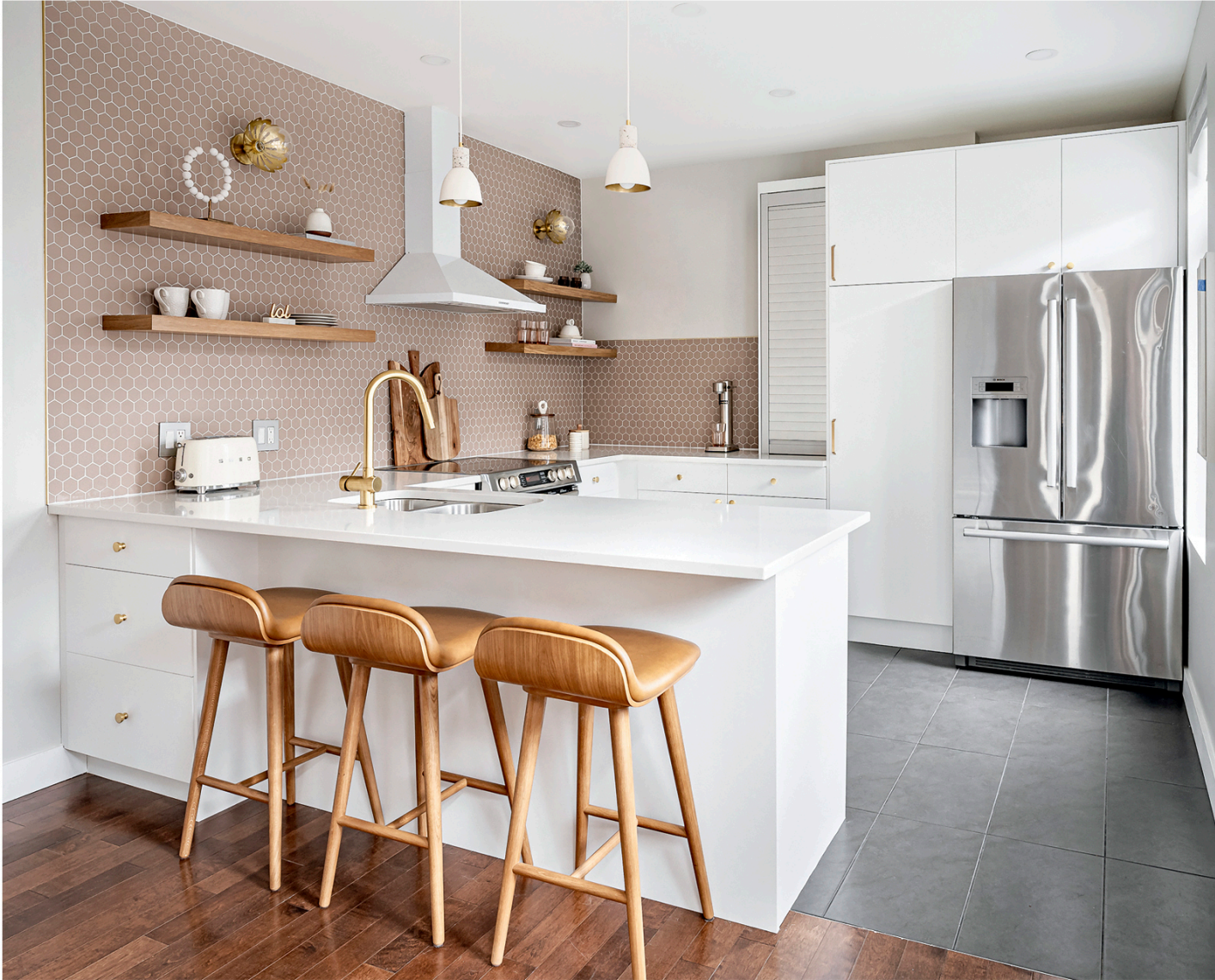
▲ Les tabourets de comptoir et les tablettes installées de part et d'autre de la hotte s'harmonisent parfaitement au plancher de bois. Leur teinte chaude ne manque pas de réchauffer l'atmosphère.