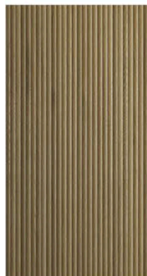
Carreau imitation bois cannelé À partir de 8,99 $/pi 2 La Tuilerie

Aménagement : Véronique Guay, designer, 514 730-0093. Céramique : Céramique Royal. Recherche, stylisme et photo : Stéphanie Guéritaud.